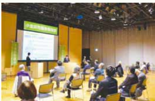
前回開催時のようす