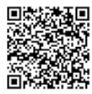
報告書はこちらから