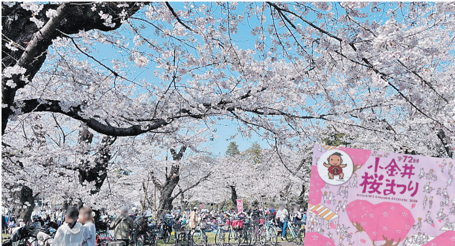
第72回小金井桜まつりの様子（3月28日、29日都立小金井公園内）