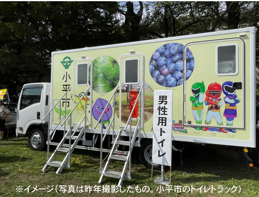
※イメージ(写真は昨年撮影したもの。小平市のトイレトラック)

大規模災害発生時、避難所等における生活環境の悪化防止及び被災者の健康被害を防ぐことを目的として導入します